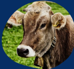
AVICULTURA Y GANADERÍA